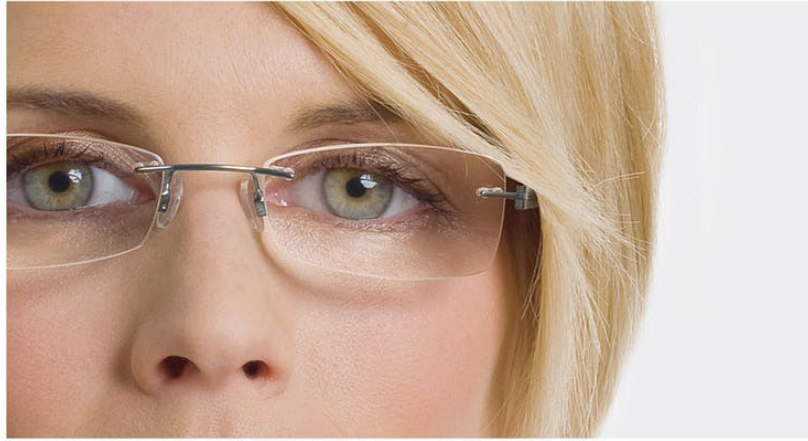
노골적인 눈 축소 효과

아이셰도우를 눈의 안쪽 가장자리에서 바깥쪽으로 칠하고 눈꺼풀의 주름을 벗어나지 않도록 하십시오. 어두운 아이라이너나 아이펜슬로 눈꺼풀 가장자리를 강조하십시오. 이렇게 하면 눈이 더 작아보입니다. 렌즈의 확대 효과 때문에 잘못된 화장은 눈에 더 잘 띄므로, 모든 화장은 주의해서 하십시오. 눈썹 위쪽에는 마스카라를 너무 많이 바르지 않고 아래쪽에는 마스카라를 바르지 않거나 아주 조금만 바르십시오.