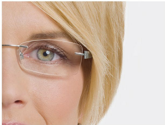
노골적인 축소 효과

근시 안경을 쓰는 경우에는 원시의 경우와 반대로 눈이 더 작아보입니다. 따라서 근시가 있는 여성은 어두운 아이셰도우나 두꺼운 아이라이너를 피해야 합니다. 장미, 라벤더, 베이지, 연회색 또는 흰색 등의 밝고 반짝이는 색상을 선택하십시오.