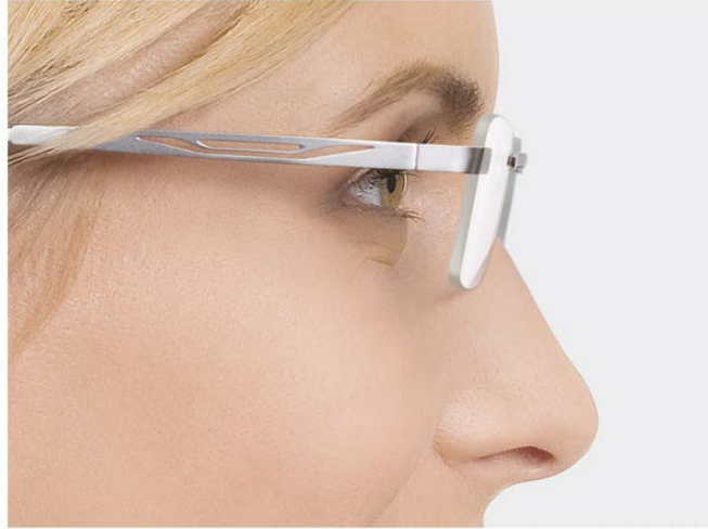
오늘날의 굴절력이 높은 재료 덕분에 렌즈의 크기가 작아졌습니다.

물론 렌즈가 너무 두꺼워지지 않도록 해야 합니다. 고탄력 재료를 사용하면 높은 도수의 안경이 필요한 여성들도 얇고 세련된 렌즈를 사용할 수 있고(> 하이인덱스 ) 얼굴에서 안경이 너무 튀지 않도록 할 수 있습니다.